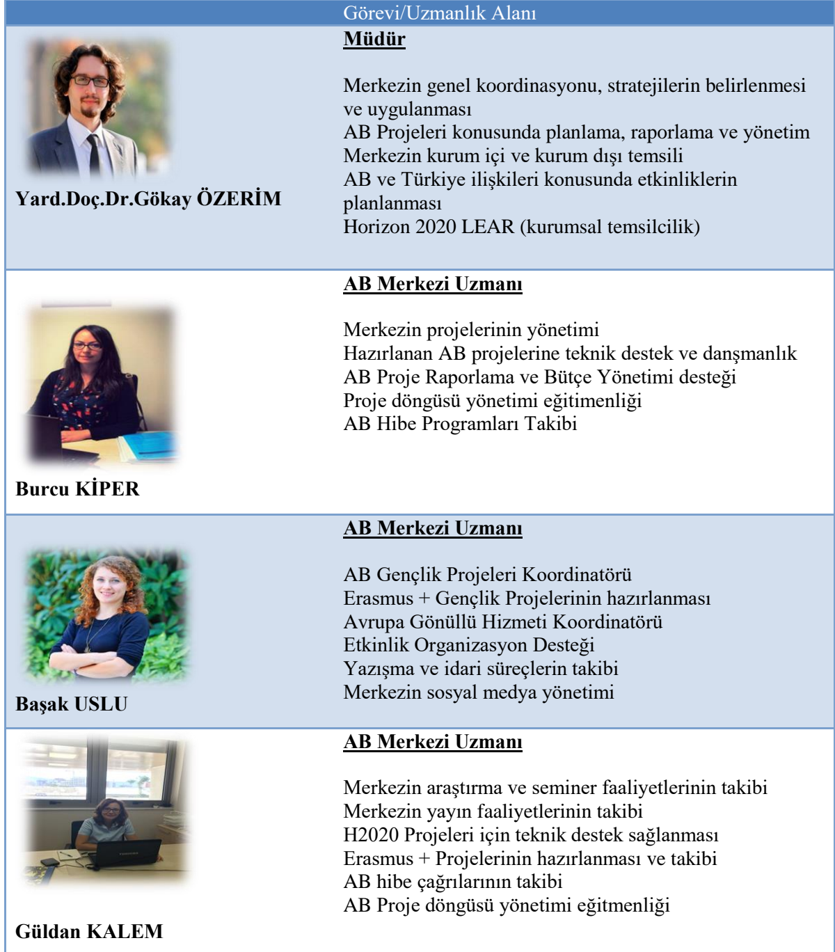
Tablo 1: AB Merkezi Personeli ve Uzmanlık Alanları