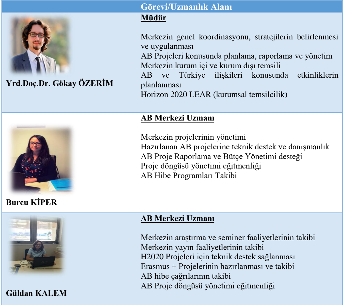
Tablo 1: AB Merkezi Personeli ve Uzmanlık Alanları