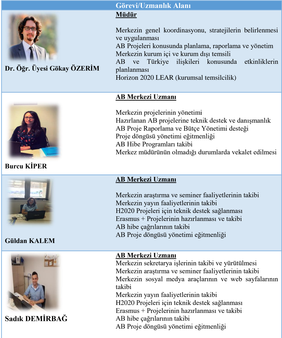
Tablo 1: AB Merkezi Personeli ve Uzmanlık Alanları